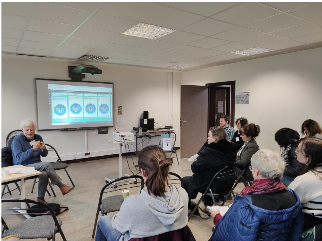
Clôture de la journée