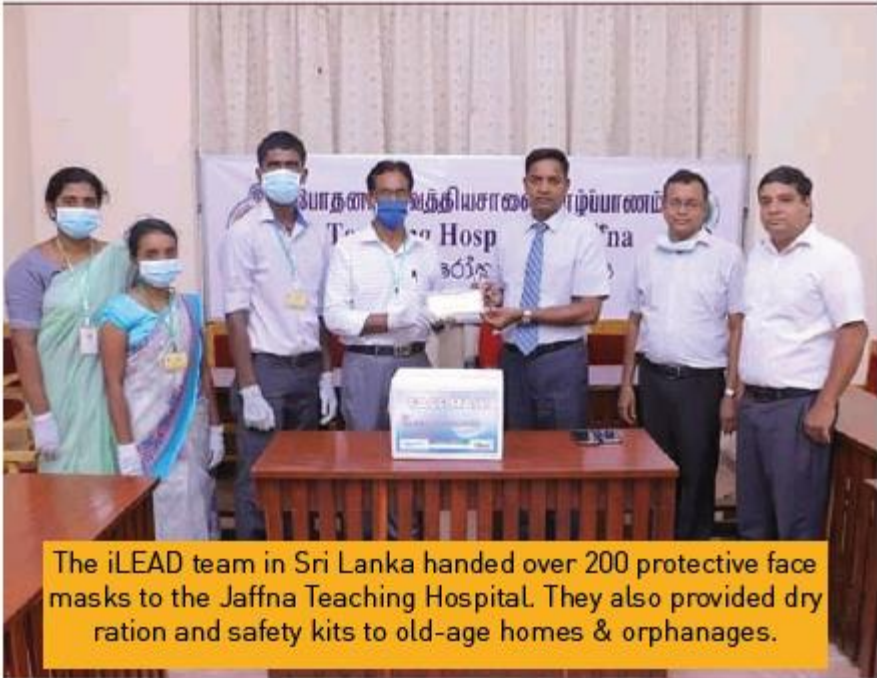
The iLEAD team in Sri Lanka handed over 200 protective face masks to the Jaffna Teaching Hospital. They also provided dry ration and safety kits to old-age homes & orphanages.