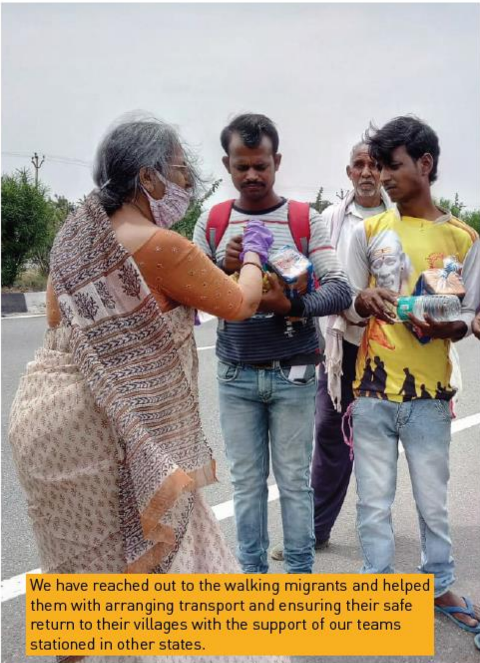
We have reached out to the walking migrants and helped them with arranging transport and ensuring their safe return to their villages with the support of our teams stationed in other states.