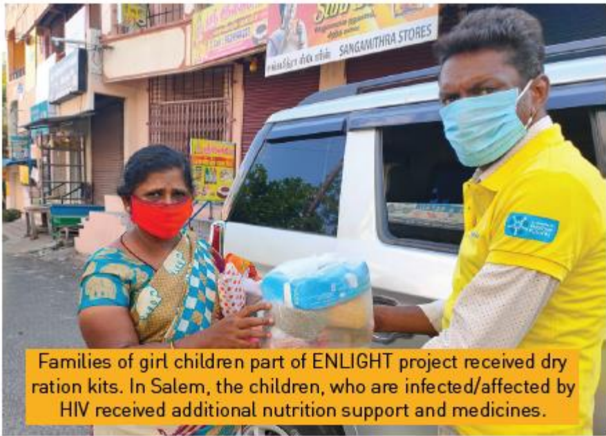
Families of girl children part of ENLIGHT project received dry ration kits. In Salem, the children, who are infected/affected by HIV received additional nutrition support and medicines.