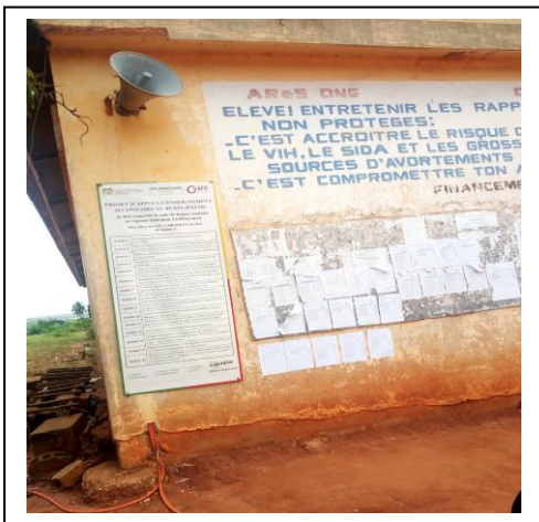
Affichage du code de bonne conduite au CEG1 Ab-Calavi dans la Commune de Abomey-Calavi (département de l'Atlantique)

Responsable du Développement de la Mission Territoire Bénin-Côte d'Ivoire Togo/Aide et Action