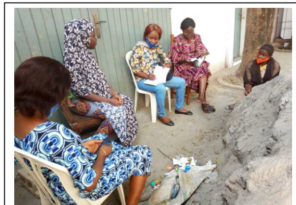
Séance d'enquête par le chef de la promotion sociale, la surveillante générale du CEG, le chef projet PAESB sur la dénonciation du cas de mariage précoce au domicile de la victime (élève fille en classe de 5ème) en présence de sa grande sœur