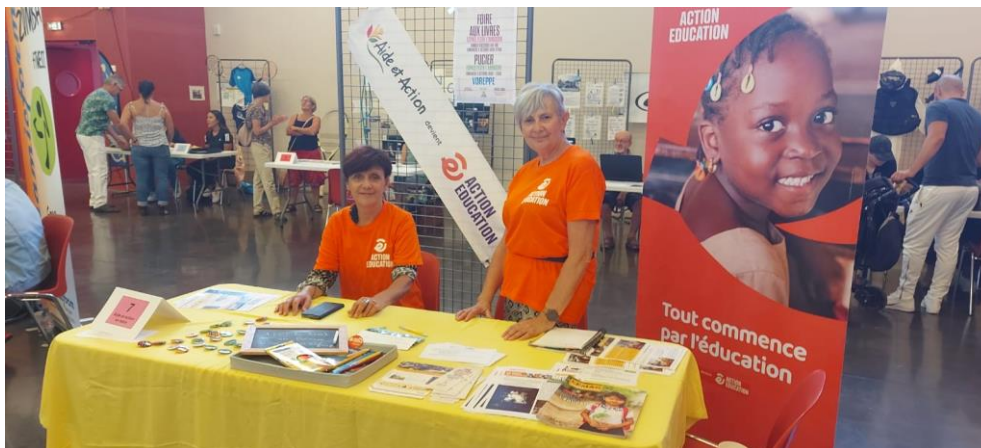
Les bénévoles d'Action Education Isère au forum des associations.