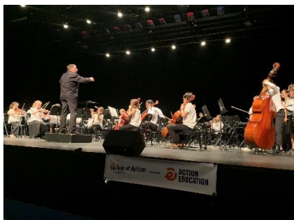
Concert solidaire organisé par l'équipe bénévole de Coignières.

Organisation d'un concert ou festival solidaire, lors duquel les bénéfices sont - tout ou partie - reversés à Action Education. La collecte peut se faire sur les billets d'entrée et/ou sur une buvette tenue par les bénévoles. Vous pouvez envisager de tenir un stand pendant l'événement et de présenter l'association au début ou à la fin. L'opportunité d'organiser ce type d'événement repose souvent sur des connaissances personnelles, mais certains groupes de musique peuvent aussi proposer ce genre d'initiatives à des associations, ou vous pouvez envisager de solliciter des groupes locaux.