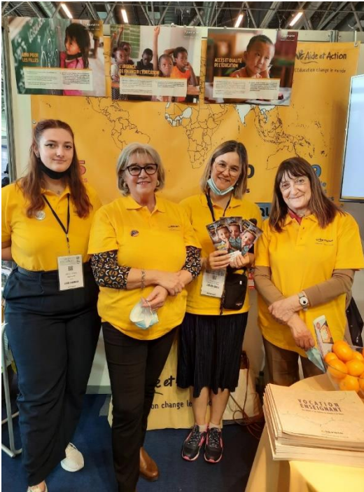
Les équipes Action Education d'Île-de-France au Salon des séniors à Paris.