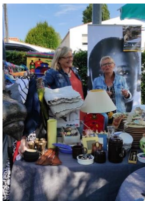
Vide grenier à La Rochelle.

Vous pouvez tenir un stand Action Education lors de marchés, marchés de Noël et vide-greniers. Différents objets peuvent être vendus : de la nourriture, des boissons ou des objets confectionnés par vos soins (tableaux, objets artisanaux).