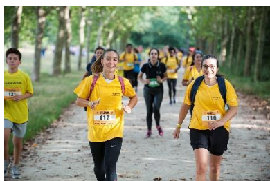
La course des cartables à Paris.

Organisation d'une course solidaire ou d'une marche solidaire, la collecte se fait sur les tickets achetés pour participer à l'événement ou sur les bénéfices liés à la vente de collations (nourritures, boissons). Les membres d'une équipe bénévole peuvent aussi courir aux couleurs d'Action Education lors d'une course organisée par une autre structure et dans ce cas, créer une page de collecte en soutien à leur initiative.