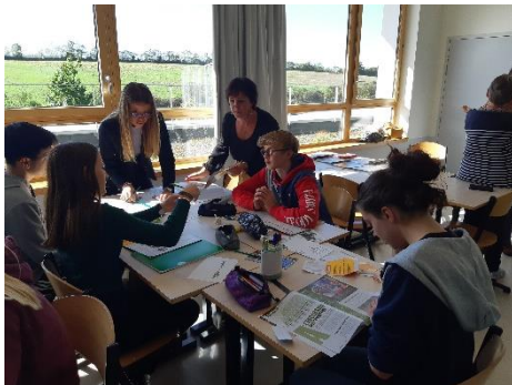
Intervention des bénévoles de l'équipe de Chemillé sur l'accès à l'éducation et l'engagement auprès d'une classe de seconde.

De nombreuses équipes réalisent des interventions en milieu scolaire ou dans les centres sociaux. Ces interventions peuvent traiter de diverses thématiques qui gravitent autour du droit à l'éducation : développement durable, solidarité internationale, genre, etc.