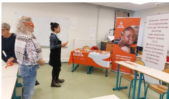
Utilisation d'Ouvrir les Yeux dans le cadre d'une intervention auprès de l'INSPÉ à Niort.

Action Education a développé une animation qui se compose d'un kakémono sur lequel un texte n'est lisible qu'avec des lunettes rouges. Cela permet de se mettre dans la peau d'une personne en situation d'illettrisme et de sensibiliser à l'importance de l'accès à l'éducation. Découvrir l'outil en vidéo.