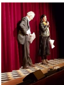
Pièce de théâtre dans le cadre du partenariat entre la Compagnie des 7 de la Cité et l'équipe des Hauts de Seine.

Partenariat avec une compagnie ou un théâtre. La collecte peut se faire sur les billets, sur une buvette tenue par les bénévoles ou sur un appel à dons. Vous pouvez envisager de tenir un stand pendant l'événement ainsi que de présenter l'association au début ou à la fin.